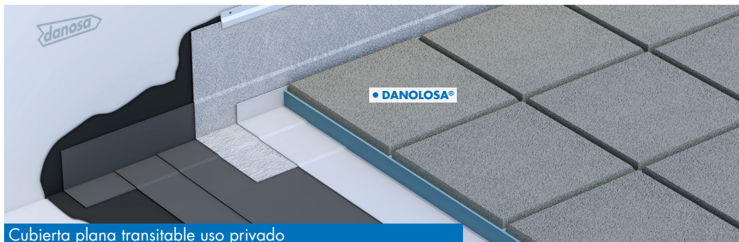
Cubierta plana transitable uso privado